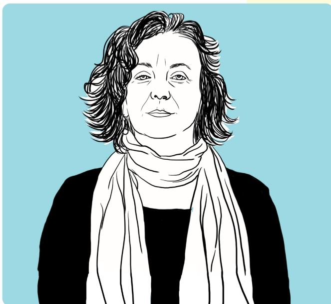
Illustration by ©2020 Transcendent Media Capital

Sub-Redes de Apoio Especializado: RAFAVH | Rede de Apoio a Familiares e Amigos de Vítimas de Homicídio CARE | Rede de Apoio a Crianças e Jovens Vítimas de Violência Sexual UAVMD | Rede de Apoio a Vítimas Migrantes e de Discriminação