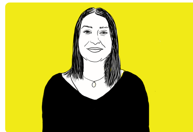
Illustrations by ©2020 Transcendent Media Capital